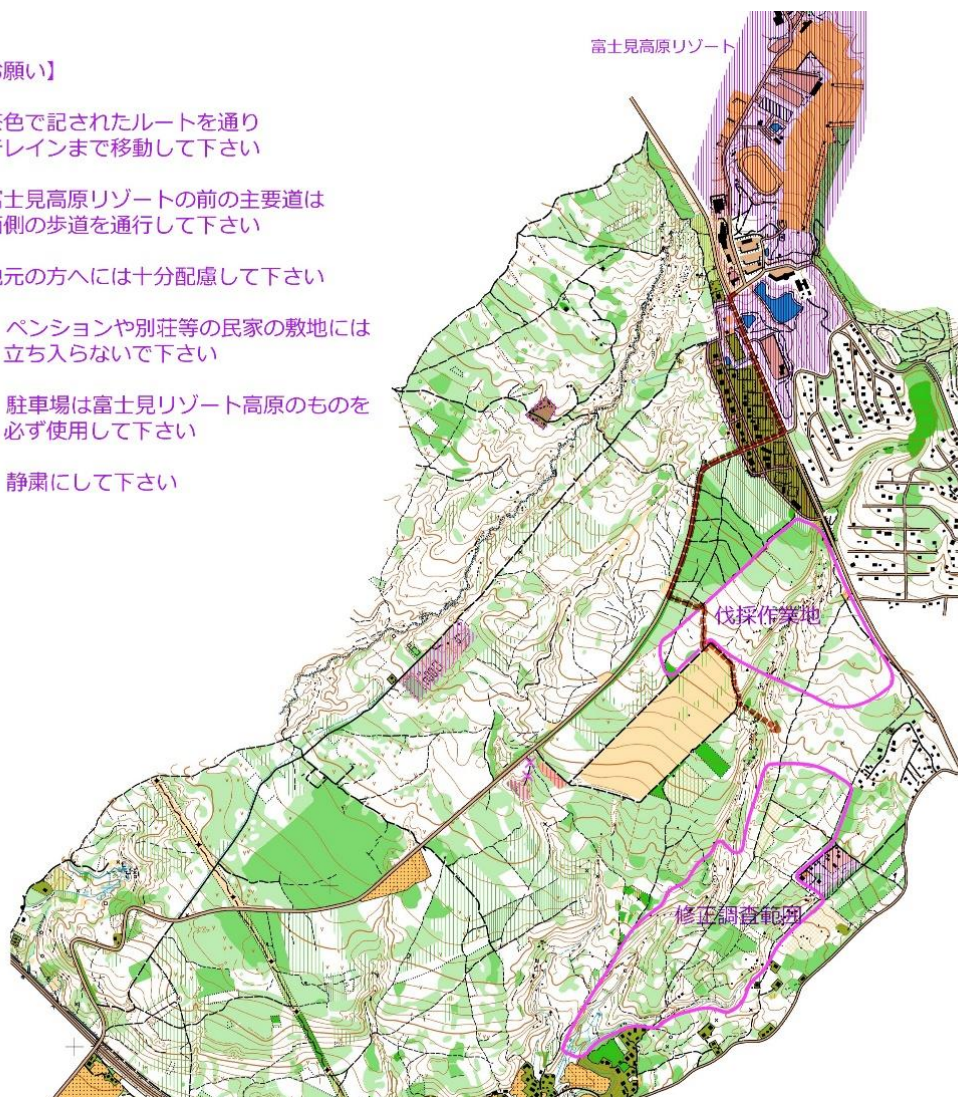
図2 駐車場からトレーニング範囲への移動ルート