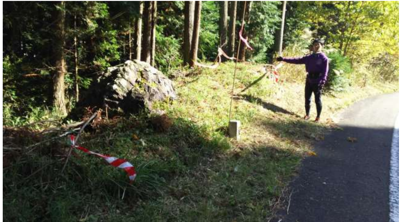
短冊状→レーンの例