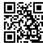
大会申込フォーム

申 込 先：〒740-1432 岩国市由宇町字深山 2273-2 山口県由宇青少年自然の家 TEL (0827)63-1513