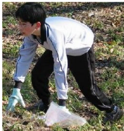
前回のジュニアチャンピオン大会より