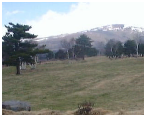
トレインからの風景 新緑と枯草と残雪の高原

5月13日(土) 13:00-マウンテンバイクオリエンテーリング 5月13日(土) 15:00-フットオリエンテーリングイベント1 5月14日(日) 9:00-フットオリエンテーリングイベント2