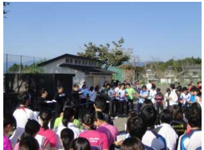
インカレロング 出走前の応援のようす (昨年10月・静岡県富士宮市)

●1日(日): 第34回早大OC大会(日本学連後援) ●7日(土)・8日(日): 第18回京大京女大会(日本学連後援) ●8日(日): 第7回岩県大会(日本学連後援) ●14日(土): 第2回幹事会 ●15日(日): 第36回東北大学大会(日本学連後援) ●21日(土)～23日(月・祝): 第1回学連合宿 ●24日(日): いぶき第2号発行 ●28日(土)・29日(日): 北海道大学大会 ●29日(日): 新潟大学大会