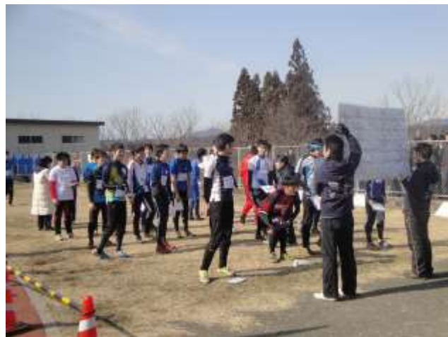
インカレリレー 男子選手権出走前 (3月9日・栃木県矢板市)