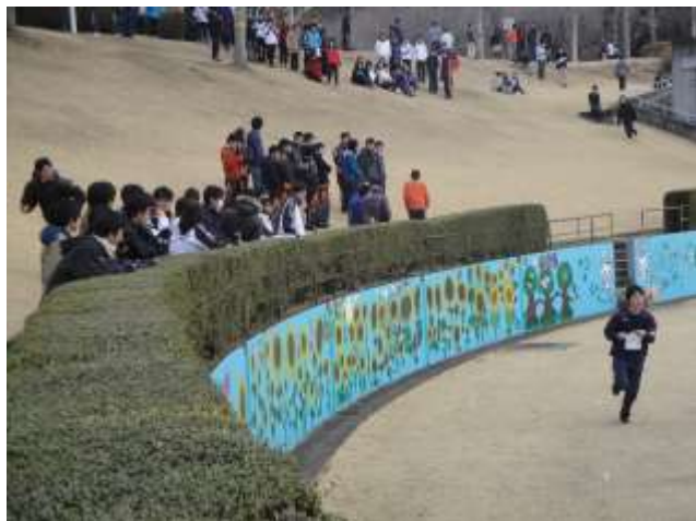
インカレスプリント実験大会 (3月7日・栃木県矢板市)

会計：会計中間報告、予算案作成 事業：幹事会取りまとめ、春インカレ開会式運営関連準備、後夜祭・講習会準備 広報：日本学連メーリス登録、いぶき発行、幹事会・総会議事録発行、日本学連ホームページ更新、Twitter開設・更新 事務局：加盟登録受付、賛助会員受付、後援申請、地図販売・各種申請受付 普及：賛助会員募集、春インカレ観戦ガイド作成 渉外：日光所野・矢板テレインへの渉外活動