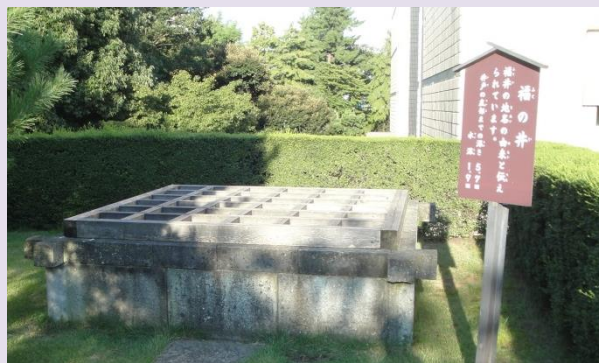
「福井」の名の由来と言われる『福の井』（福井市）